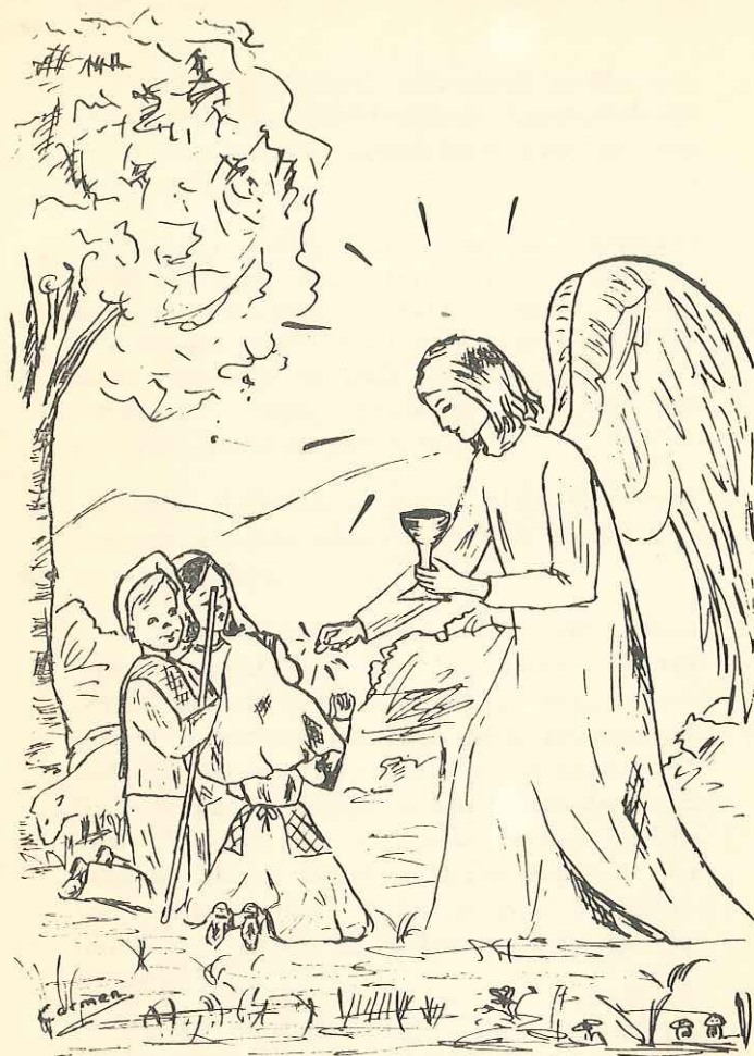
Aingerua barrero agertu yaken, Altarako Jesus eharrela.

Egun baten, ardiak zainduten egozala, Andra Maria'ren ikustaldia izan eben. Andia da, gero! Jaungoikoak zuok lako umeai mundua salbatzeko laguntza eskatu!